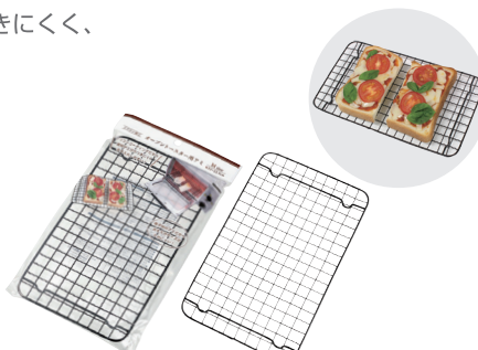
0306-670 シリコン加工 オープントースター用アミ Mサイズ