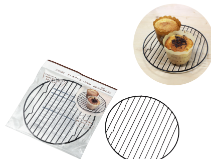
0706-160 シリコン加工 ケーキクーラー 17cm