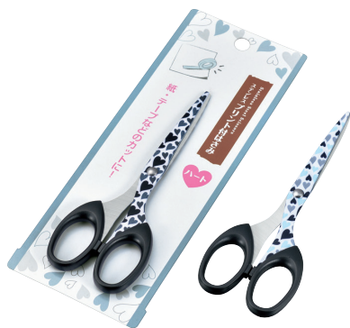
1159-421 ステンレスプリント付はさみ(ハート)