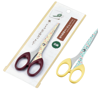
1159-420 ステンレスプリント付はさみ(花柄)