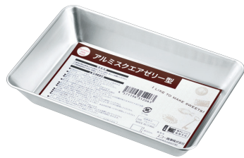
0747-169 アルミスクエアゼリー型