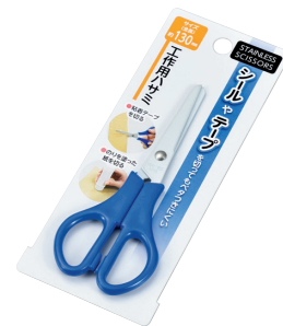
1199-422 工作用ハサミ 約130mm