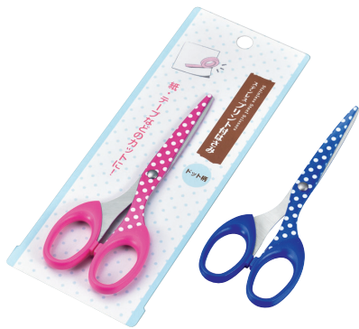
1159-419 ステンレスプリント付はさみ(ドット柄)