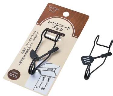
0659-309 レンジフードフック(キッチンツール)