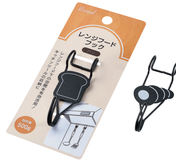
0659-310 レンジフードフック(パン)