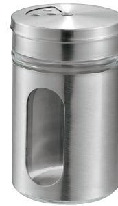
0449-240 ガラス調味料入れ(80ml)カバー付