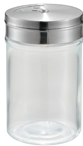
0449-239 ガラス調味料入れ(80ml)