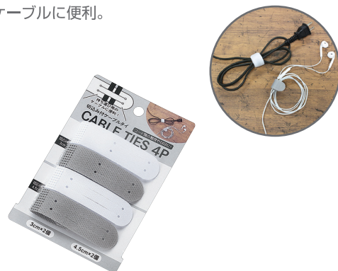
1099-164 切込み付ケーブルタイ 4P