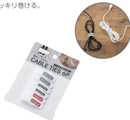
1099-165 短めケーブルタイ 6P