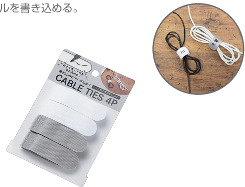
1099-163 書き込めるケーブルタイ 4P