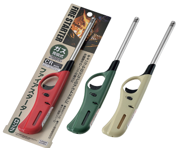
0847-091 ファイアスターター ロングタイプ