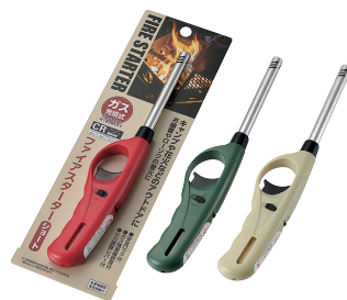
0847-092 ファイアスターター ショートタイプ