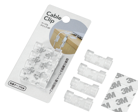
1006-178 ケーブルクリップ 4P