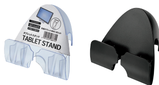
1047-176 タブレットスタンド