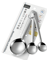
0336-742 計量スプーン 3本組