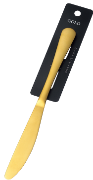
1799-421 ゴールド ディナーナイフ