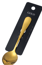
1799-425 ゴールド ティースプーン