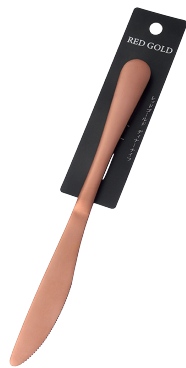
1799-415 レッドゴールド ディナーナイフ