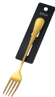
1799-423 ゴールド ディナーフォーク