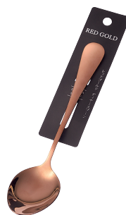
1799-416 レッドゴールド ディナー Spoon