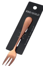
1799-420 レッドゴールド ケーキフォーク