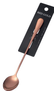
1799-418 レッドゴールド ソーダ Spoon