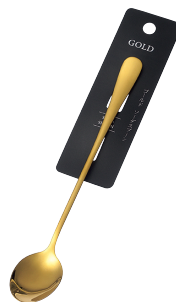
1799-424 ゴールド ソーダ Spoon