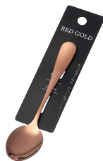
1799-419 レッドゴールド ティースプーン