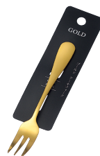
1799-426 ゴールド ケーキフォーク