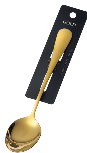
1799-422 ゴールド ディナー Spoon